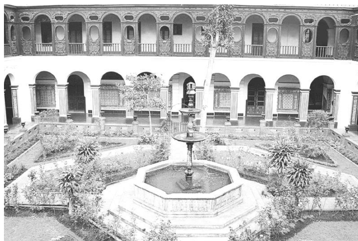
Casona de San Marcos